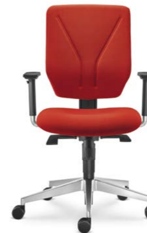
330-SY ■ + BR-209-N6