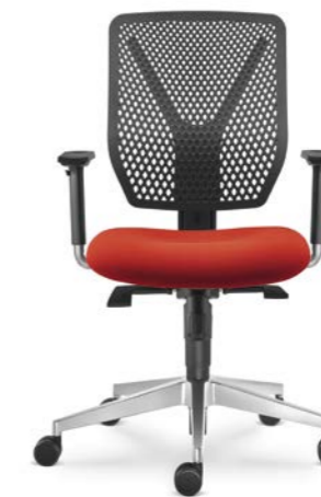
320-SY ■ + BR-209-N6