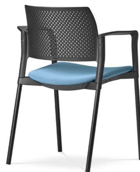
Dream+ 100-BL/B-N1 ■