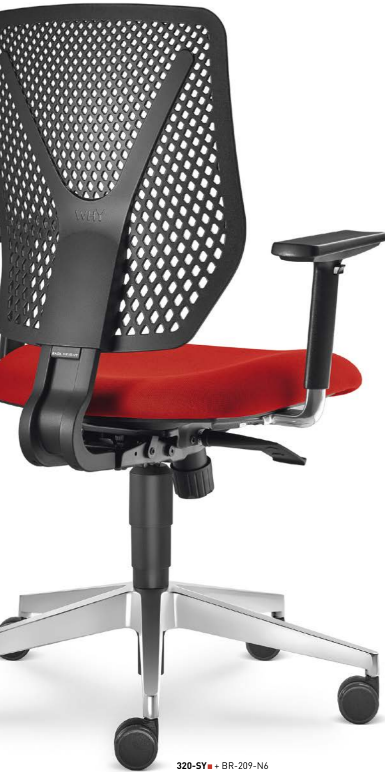
320-SY + BR-209-N6