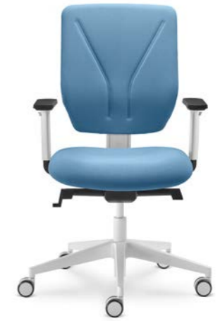
331-SYS ■ + BR-209/WH