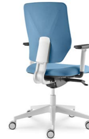
331-SYS ■ + BR-209/WH