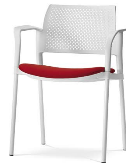
Dream+ 100-WH/B-N0 ■