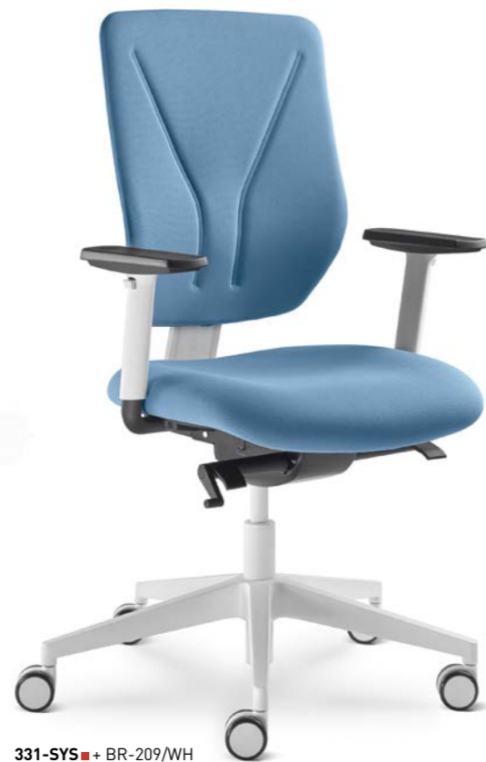
331-SYS ■ + BR-209/WH