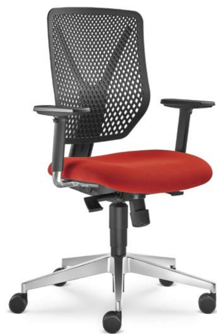
320-SY ■ + BR-209-N6

Pour compléter les chaises Why, nous vous recommandons les chaises Dream+ ou les chaises Go! en tant que les chaises de visite. Il est également possible d'équiper ces chaises par des éléments blancs et noirs, les dos des chaises sont aussi fortement perforés.