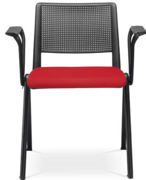
GO! 115-N1 + BR-112