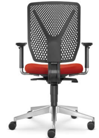
320-SY ■ + BR-209-N6