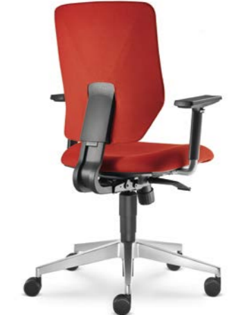
330-SY ■ + BR-209-N6