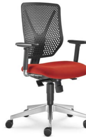
320-SY ■ + BR-209-N6