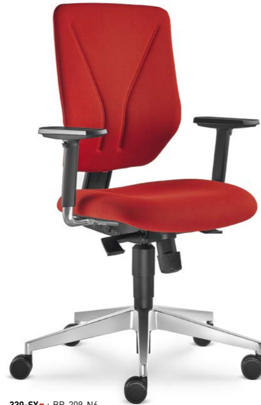
330-SY + BR-209-N6