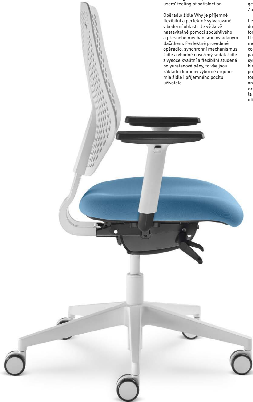
321-SYS ■ + BR-209/WH

Le dos de la chaise Why est doucement flexible et parfaitement formé dans une partie lombaire. Il est réglable en hauteur par un mécanisme fiable et précis qui est commandé par un bouton. Le dos parfaitement réalisé, le mécanisme synchrone de la chaise et le siège bien conçu d'une mousse froide en polyuréthane souple et de qualité, tout ces éléments sont des pierres angulaires de l'ergonomie excellente de la chaise et de la sensation agréable de son utilisateur.