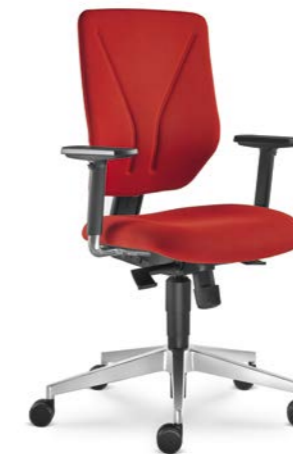
330-SY ■ + BR-209-N6