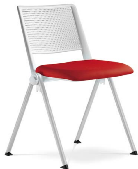
GO! 116-N0 ■