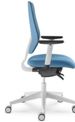
331-SYS ■ + BR-209/WH