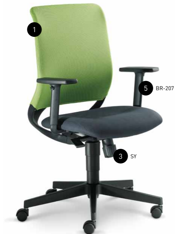
260-SY + BR-207