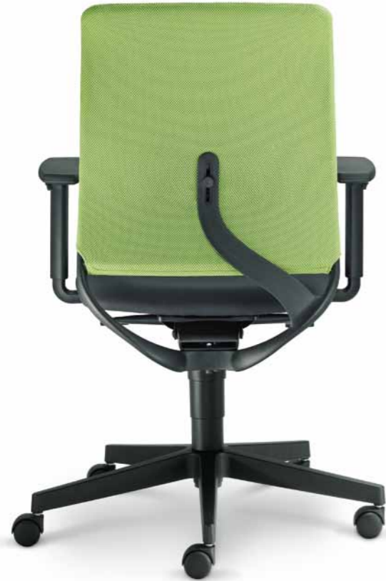
260-SY ■ BR-207

Théo® présente un design novateur grâce à la forme exclusive de sa structure de dossier intégrant une « virgule » sur laquelle est gérée le réglage lombaire. La qualité élevée de tous les composants mis en œuvre sur Théo® permet à cette série de sièges de répondre aux exigences de la plupart des utilisateurs de sièges opératifs. Le choix entre plusieurs mécanismes, accoudoirs, piétements ainsi qu'une large palette de tissus et de coloris de maille de dossier renforce encore la forte personnalité de Théo®. Enfin Théo® est en grande partie recyclable. Théo®, s'impose donc comme le meilleur rapport qualité/prix/design/ergonomie/respect de l'environnement des sièges à dossier filet.