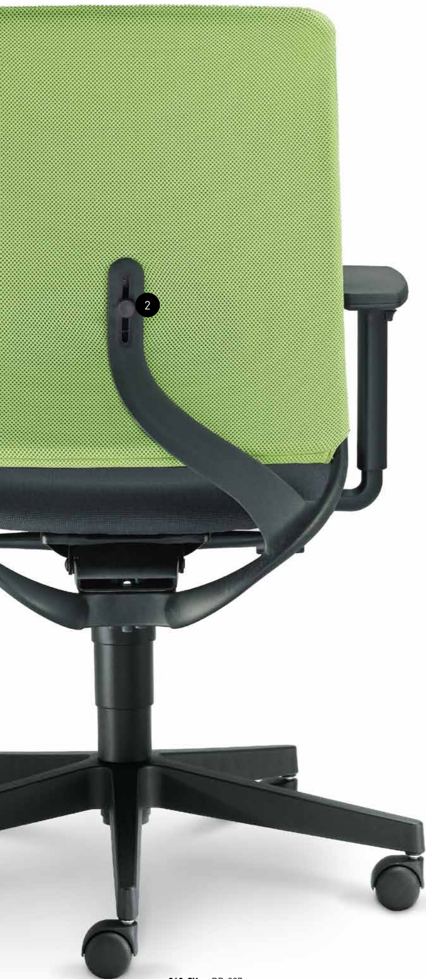
260-SY + BR-207