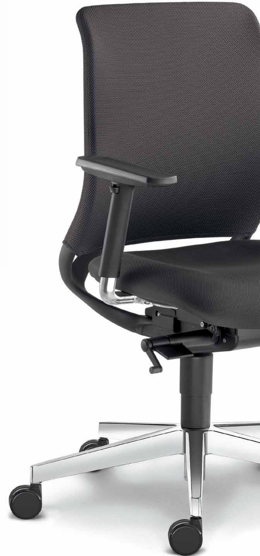
260-SYS ■ + BR-209-N6