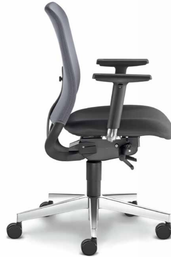
260-SYS ■ + BR-209-N6