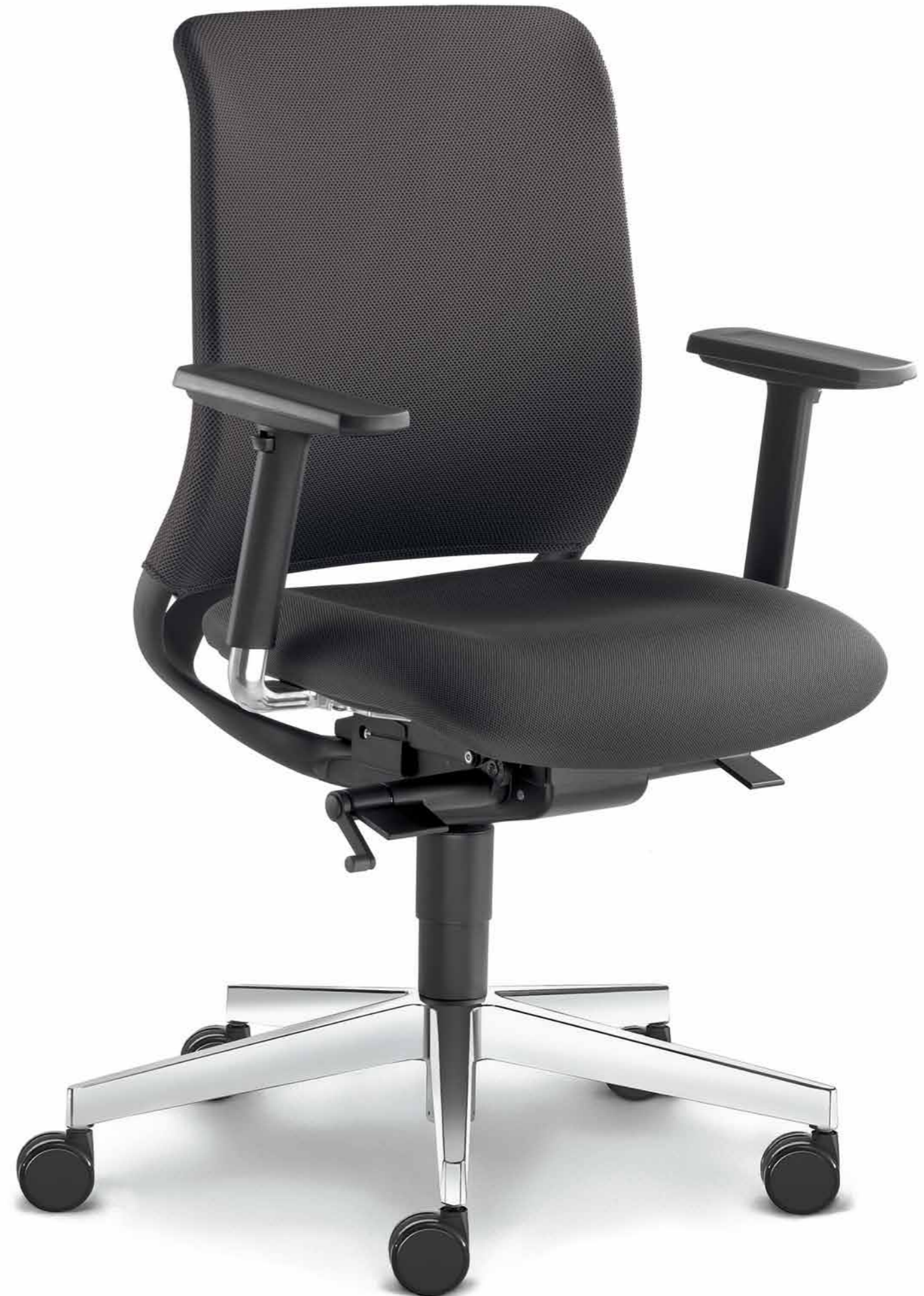
260-SYS ■ BR-209-N6