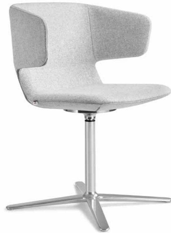
FLEXI/P, F25-N6 ■

With an in-built mechanism in the backrest to ensure the flexibility of the backrest's upper part, Flexi/CHL conference and meeting chairs introduce an innovative feature, which significantly increases the chair's comfort for users.