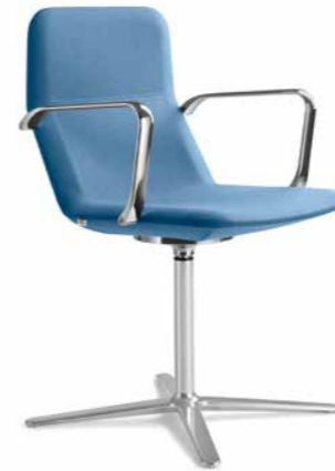
FLEXI/CHL-BR, F25-N6 ■

Modèles de conférence et de réunion Flexi / CHL dissimulent un nouveau concept innovant. Le siège subtil intègre un mécanisme assurant la flexibilité d'une partie supérieure du dossier. Cet élément augmente considérablement le confort de siège d'un utilisateur.