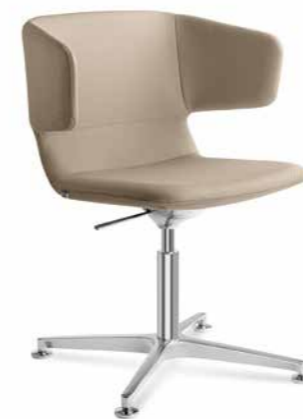
FLEXI/P-PRA, F60-N6 ■