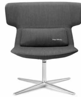
FLEXI/L, F27-N6 ■