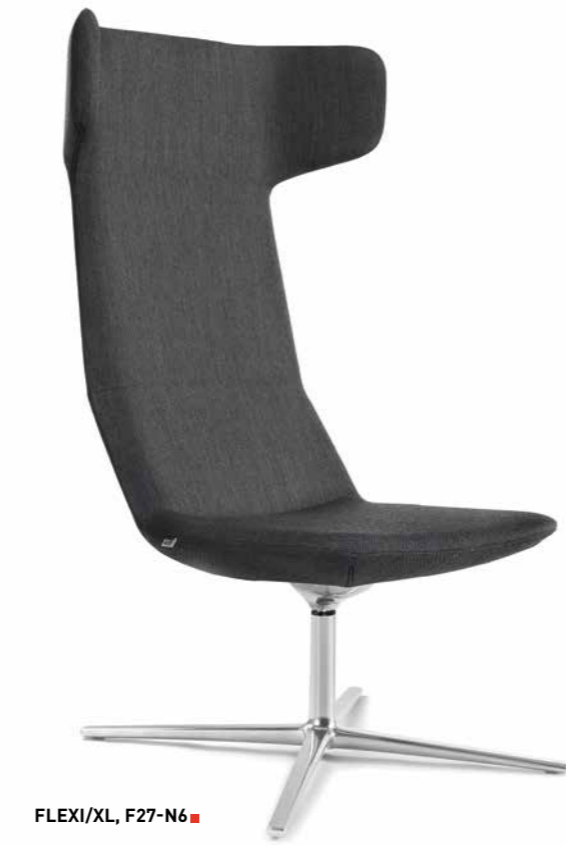
FLEXI/XL, F27-N6 ■