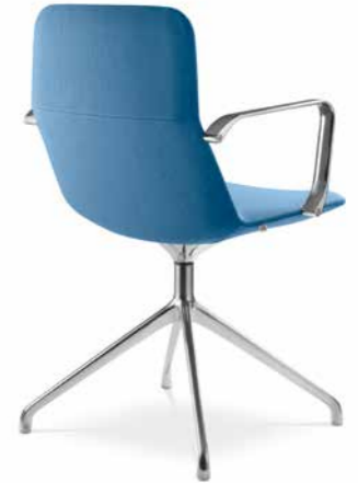
FLEXI/CHL-BR, F20-N6 ■