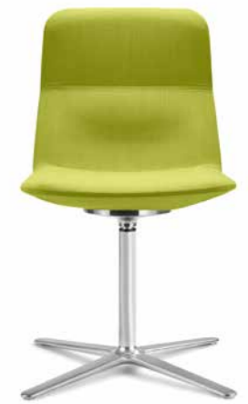
FLEXI/CHL, F25-N6 ■