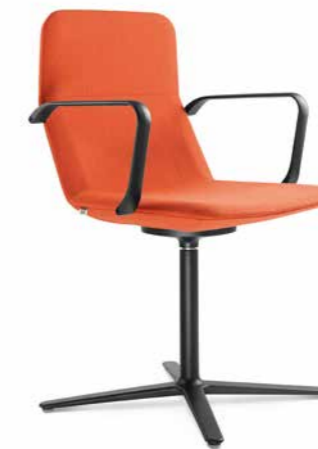
FLEXI/CHL-BR, F25-N1 ■