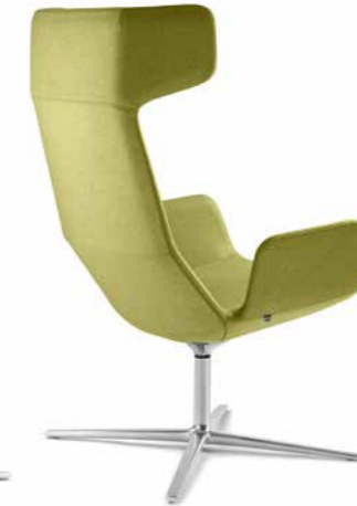
FLEXI/XL-BR, F27-N6 ■