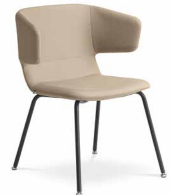
FLEXI/P, K-N1 ■