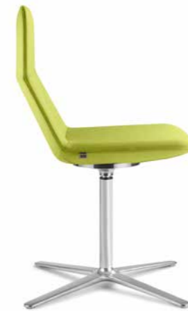
FLEXI/CHL, F25-N6 ■