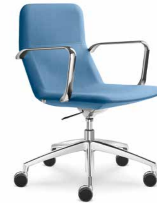
FLEXI/CHL-BR, F50-N6 ■